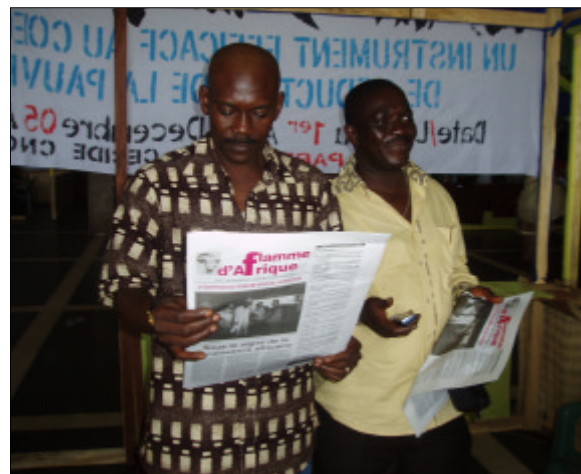
Flamme d'Afrique au Forum social africain de Conakry, en décembre 2005.

Ps : Un dernier numéro sera produit et diffusé en ligne, sur le site http://flamme.panos-ao.org