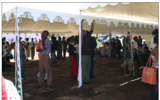
Démontage du Windsor après l'assaut des manifestants : pour le restaurant le plus huppé du site, le Fsm s'est terminé avec un jour d'avance.